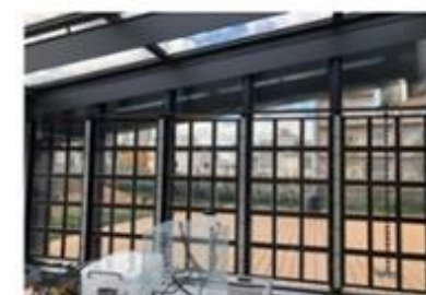
後付け工法による光発電ガラスの試作設置例