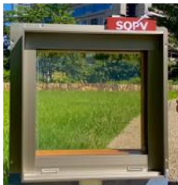
光発電ガラス初期モデル