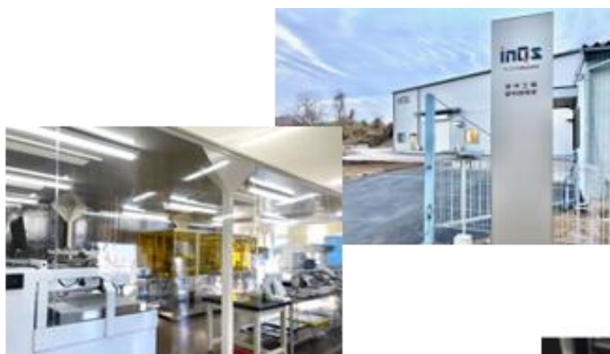
自社パイロット工場